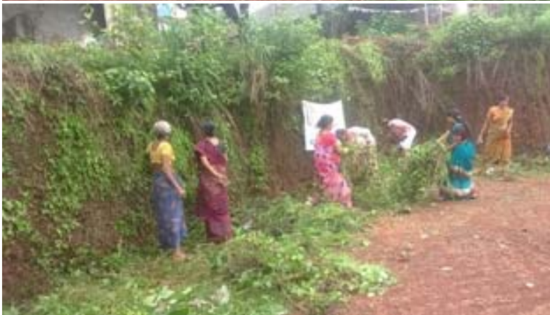
ഈസ്റ്റ് എളേരി ഗ്രാമ പഞ്ചായത്ത്