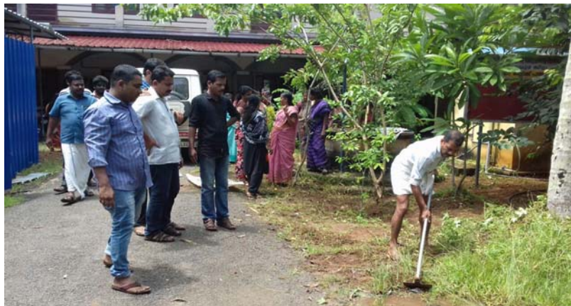
ആര്യട് ബ്ലോക്ക് പഞ്ചായത്ത്