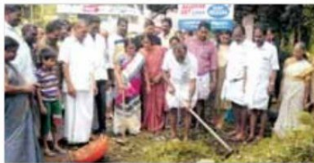
ശ്യാമപ്രസാദ് ഗുപ്തപഞ്ചായത്തിൽ നടത്തുന്ന ശുചീകരണ പ്രവർത്തനങ്ങൾ വി.പി. സജിത്രൻ എം.എൽ.എ. ഊർഘാടനം ചെയ്യുന്നു