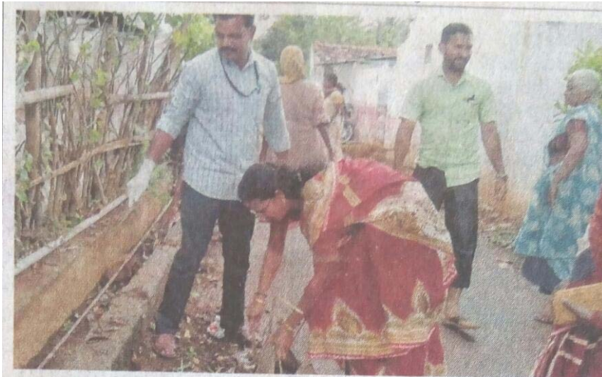
ശുചിത്വ മിഷന്റെ നേതൃത്വത്തിൽ മറയൂരിൽ ബാബുനഗർ വാർഡിൽ ശുചീകരണ പ്രവർത്തനങ്ങൾ നടത്തുന്നു.