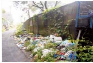
മാലിന്യം നിറഞ്ഞ അകമാലി വ്യവസായ മേഖല റോഡ്.

കരിയാട്: അകമാലി വ്യവസായ മേഖലയിലേക്ക് നെടുമ്പാറ്റേരി പഞ്ചായത്തിൽ നിന്ന് എളുപ്പത്തിൽ പ്രവേശിക്കാവുന്ന വ്യവസായ മേഖലാ റോഡിൽ കൂടിക്കിടന്ന മാലിന്യം നീക്കി. സംസ്ഥാന സർക്കാർ പ്രഖ്യാപിച്ച തീവ്ര ശുചീകരണ പരിപാടിയുടെ ഭാഗമായി നെടുമ്പാറ്റേരി പഞ്ചായത്തിലെ 5-ാം വാർഡ് ശുചിത്വ കമ്മിറ്റിയുടെ നേതൃത്വത്തിലാണ് മാലിന്യം നിറഞ്ഞ റോഡ് ഒരു ദിവസംകൊണ്ട് വൃത്തിയാക്കിയത്. വ്യവസായ മേഖലയിൽനിന്നും ഡ്രൈവ് വെക്കുന്ന ഇവിടെ മാലിന്യം നിക്ഷേപിച്ചിരുന്നു. പ്ലാസ്റ്റിക് മാലിന്യങ്ങളും, ഡ്രൈവ് വെക്കുന്ന ഇടങ്ങളും നിറഞ്ഞ റോഡ് ജന