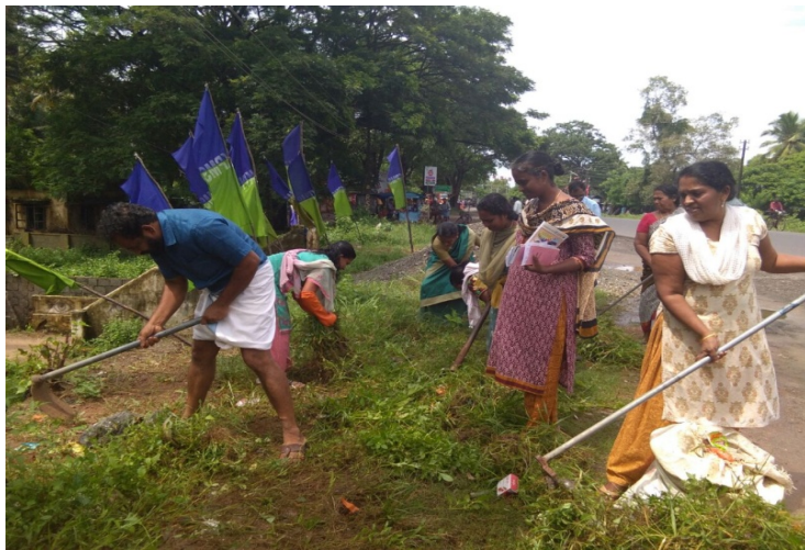
പുന്നപ്ര വടക്ക് ഗ്രാമപഞ്ചായത്ത്