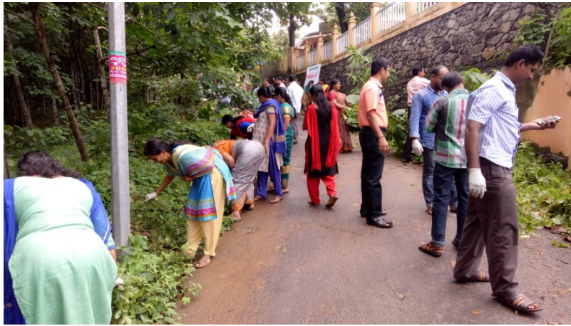
കാഞ്ഞിരപ്പള്ളി ബ്ലോക്ക് പഞ്ചായത്ത്