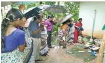
വഴിക്കടവിൽ വള്ളിക്കാട്ടിലെ വീടുകളിൽ ആരോഗ്യവകുപ്പ് പരിശോധന നടത്തുന്നു