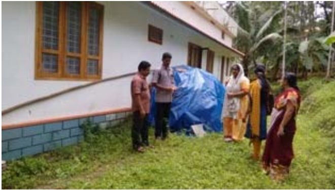
കുമ്പുലാജെ ഗ്രാമ പഞ്ചായത്ത്