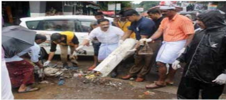
എടപ്പാൾ പട്ടണത്തിൽ മന്ത്രി കെ.ടി. ജലീലിന്റെ നേതൃത്വത്തിൽ നടന്ന ശുചീകരണം