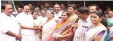
പകർച്ചപ്പനി പ്രതിരോധ നടപടികളുടെ ഭാഗമായി പറവൂർ നഗരസഭയുടെയും ഗവ. ആയുർവേദ ആശുപത്രിയുടെയും നേതൃത്വത്തിലുള്ള ഔഷധ വണ്ടിയുടെ പര്യടനം ഊർഘാടനം വി.ഡി. സതിശൻ എം.എൽ.എ. നിർവഹിക്കുന്നു