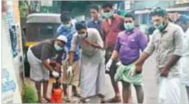
പാവട്ടപ്പുറത്ത് റോഡരികിൽ വെള്ളം കെട്ടിനിൽക്കുന്നിടത്തെ കൊമ്പുകൾ നശിപ്പിക്കുന്ന കൂബ്ബ് പ്രവർത്തകർ