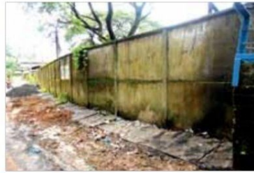
റോഡിലെ മാലിന്യം നീക്കിയ ശേഷം.