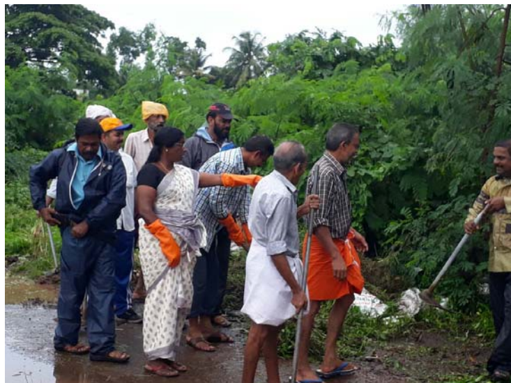
പുന്നപ്ര വടക്ക് ഗ്രാമപഞ്ചായത്ത്